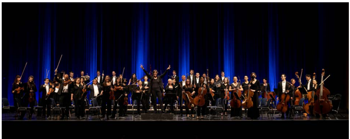
Philharmonie Salzburg