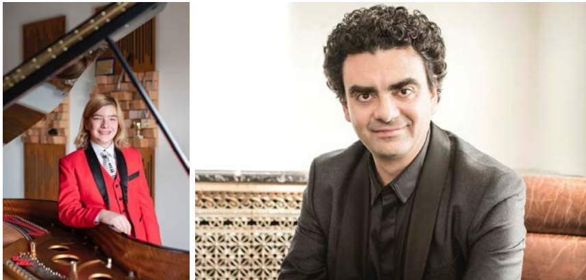
Fotos: Eilas Keller: © Bianca Jakobic, Rolando Villazon: © D. Acosta, DG