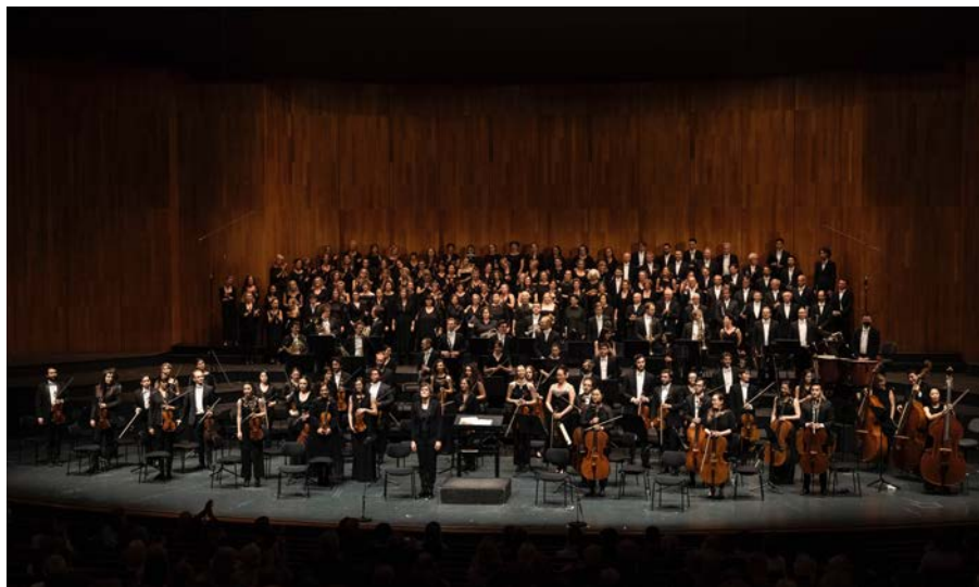
Philharmonie Salzburg und Chor der Philharmonie Salzburg im Großen Festspielhaus

Im Cross-Over-Bereich überzeugt das Orchester mit Projekten wie „Best of Hollywood“, „Broadway“ oder „Tango, Jazz und Weltmusik“. Das Orchester spielt mit Top-Solist*innen wie Juan Diego Florez, Rolando Villazon, Olga Scheps, Ferhan u. Ferzan Önder, Quadro Nuevo, Henry Threadgill, Maria Bill, Iris Berben, Cornelius Obonya und Philipp Hochmair.