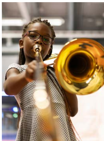
Kinderfestspiele: © Erika Mayer

Erfolgsrezept: Die Salzburger Kinderfestspiele entführen Kinder in die aufregende Welt der klassischen Musik. Die Konzertgeschichten verzaubern durch altersspezifische Rahmenhandlungen, sorgfältig ausgewählte Mitwirkende, ein Symphonieorchester auf der Bühne, mitreißende Rahmenhandlungen und interaktive Elemente, die das Publikum ins Geschehen einbinden. Auf dem Programm stehen in jeder Saison eine Ballettproduktion mit Tänzern, eine Opernproduktion mit Sängern, ein Komponistenporträt, ein Weihnachtskonzert sowie zentrale Werke der Musikgeschichte. Familienkonzerte dauern je 60 Minuten und sind für Kinder zwischen 3 und 10 Jahren geeignet. Jedes Konzert erzählt eine Geschichte, die von 1-2 Schauspielern dargestellt wird. Bei Opern wirken zusätzlich 2-4 Sänger mit, bei Ballett-Produktionen 1-2 Tänzer. Alle Werke werden in Originalbesetzung gespielt, daher ist immer ein komplettes Symphonieorchester auf der Bühne zu erleben.