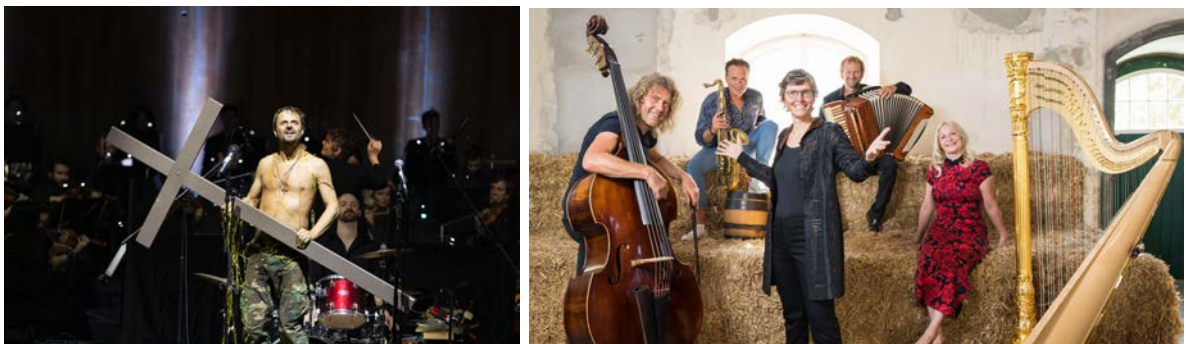
Fotos: Jedermann Reloades Symphonic: © Erika Mayer, Quadro Nuevo: © Neumayr/Leo