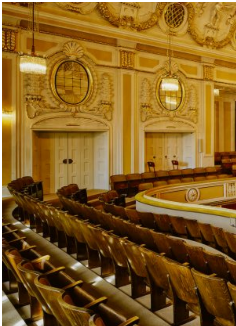
Der große Saal Mozarteum gilt mit seiner Akustik und seinem Ambiente