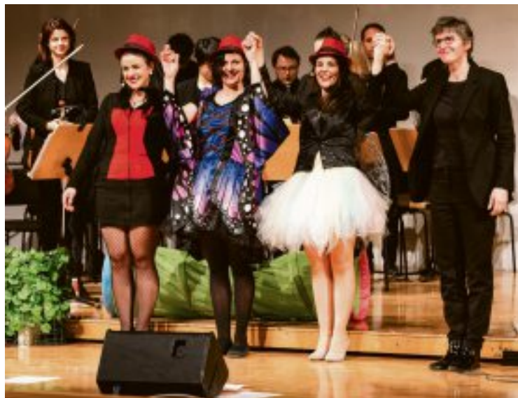
„Hollerstauden Winterzauber“ am 17./18. Dezember in der Großen Aula mit Zusatzvorstellung am Samstag um 13.00 Uhr.

In Rossinis lustiger Kinderoper hilft der frohsinnige Barbier Figaro dem Grafen Almaviva, die hübsche Rosina zu erobern. Aber das ist nicht so einfach. Es folgen einige Verkleidungen, Verwechslungen und Liebesbriefe, bis es doch zum Happy End kommt.