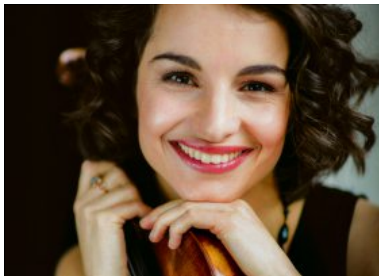
Sibelius Violinkonzert mit Alina Pogostkina am 1./2. März 2023.