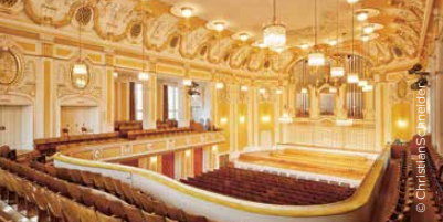
Großer Saal Mozarteum