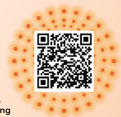
Infos & Anmeldung