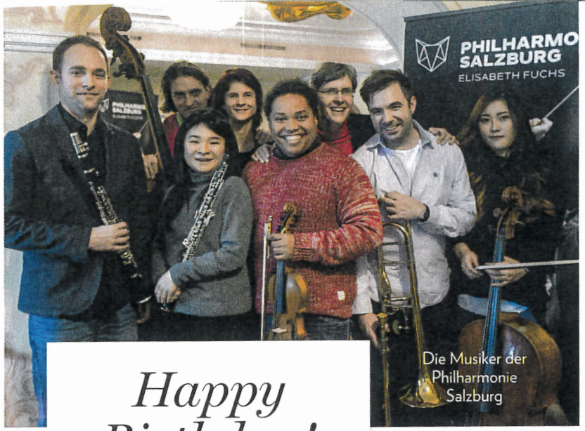
Die Musiker der Philharmonie Salzburg