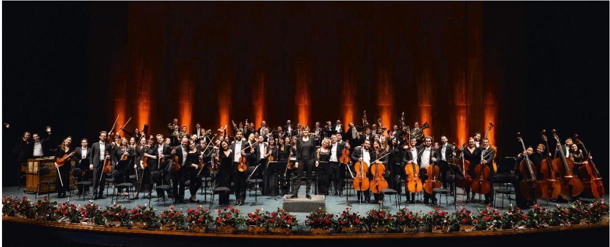
Philharmonie Salzburg im Großen Festspielhaus