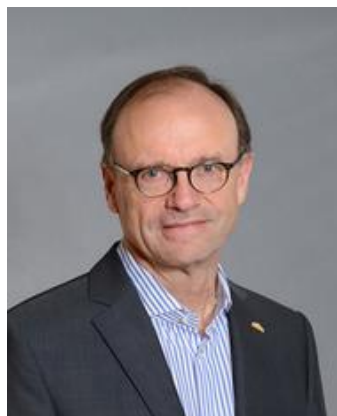
MMag. Herbert Brugger