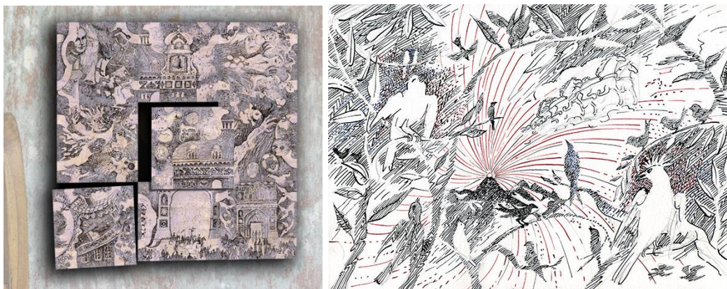
Kunst Spiel „Bilder einer Ausstellung“ und Zeichnung aus der Beethoven-Mappe © Séverin Krön

Für eine Spendensumme von 1.000€ gibt es ein privates „Hauskonzert“ eines Ensembles der Philharmonie Salzburg, bestehend aus 2 – 3 MusikerInnen.